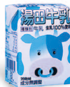
これまでの学校給食パッケージ