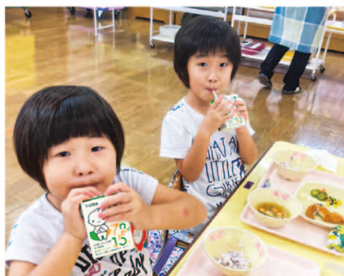
岩手県北上市立藤根幼稚園様