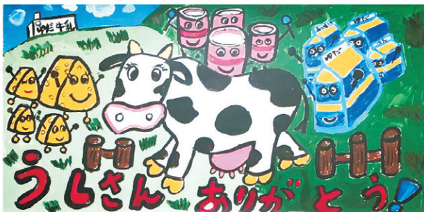
「ウシさんのお絵描きコンテスト」より