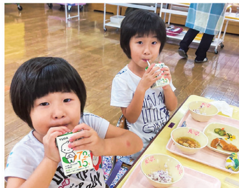
岩手県北上市立藤根幼稚園様