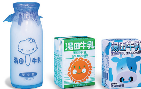
これまでの学校給食パッケージ