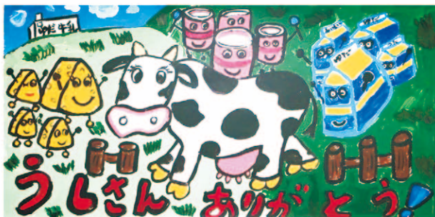
「ウシさんのお絵描きコンテスト」より