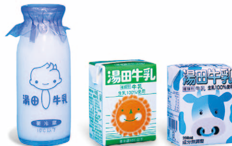
これまでの学校給食パッケージ