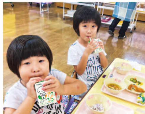
岩手県北上市立藤根幼稚園